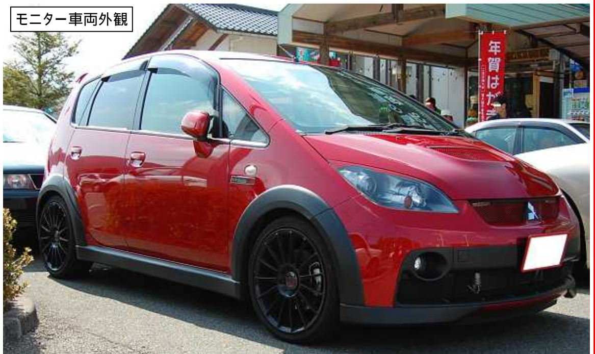
モニター車両外観

モニター車種： 三菱コルトバージョンR( 08SPEC 5MT) 形式：三菱・CBA-Z27AG